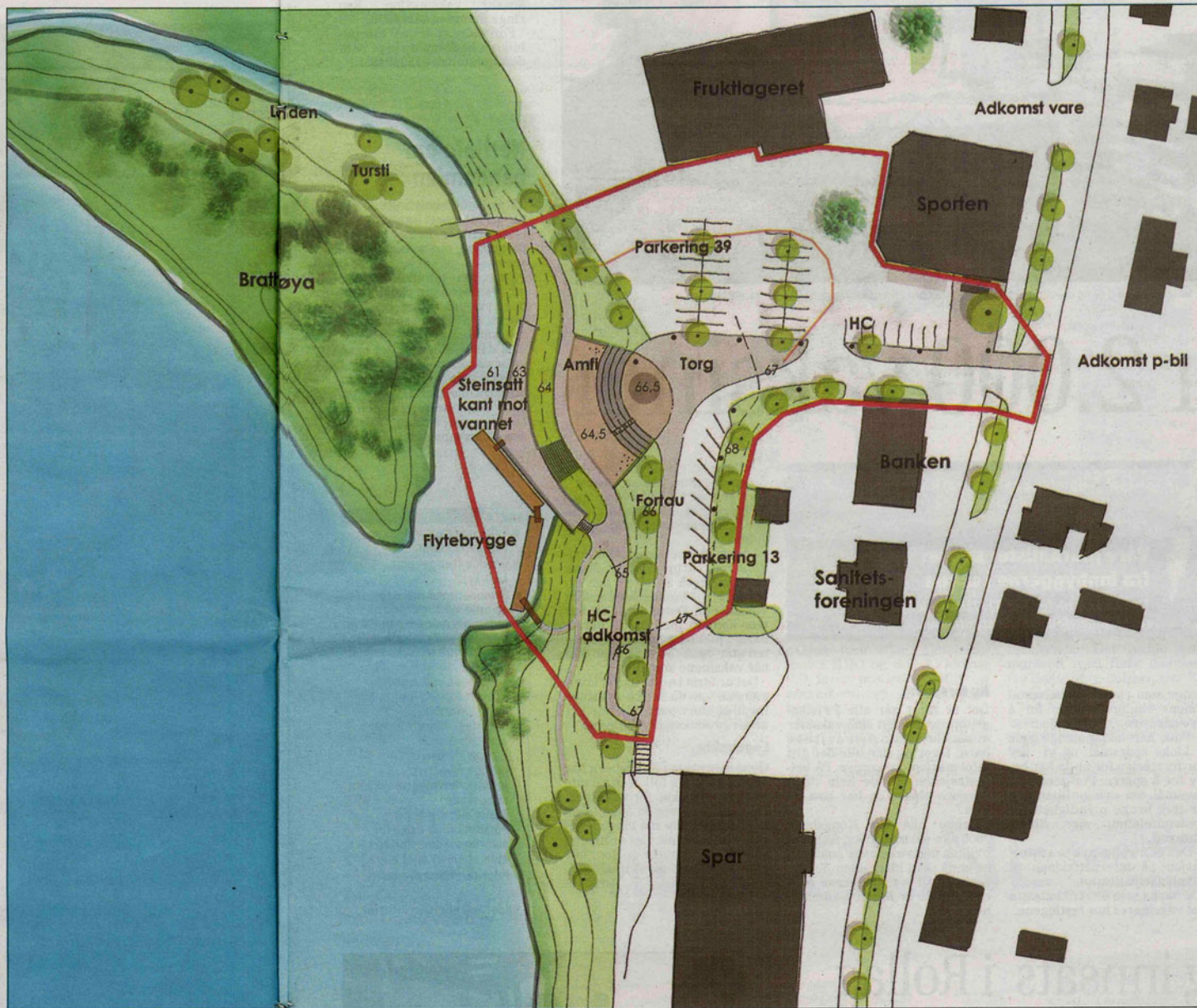
PLANEN: Landskapsarkitekt Merete Schau har laget dette forslaget til å skape «Hvitvingfoss ved Lågen».