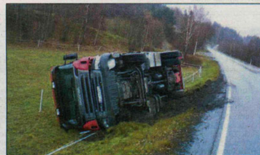
GIKK BRA: Føreren av søppelbilen måtte svinge ut mot grøfta for å unngå å frontkollidere med et vogntog. Han ble ikke skadet i velten.

Politiet ble ikke varslet om ulykken, og Reno Norden dirigerte selv trafikken på stedet. Selskapet ringte Falken, som dro bilen opp på veien igjen rundt klokka 14.15. Dahl sier at føreren av søppelbilen tok fri resten av dagen, men lover at søppelet blir tømt.